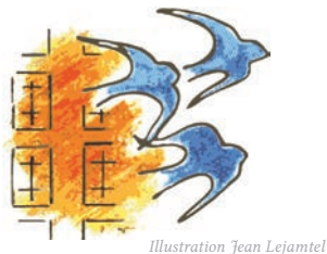
Illustration Jean Lejamel