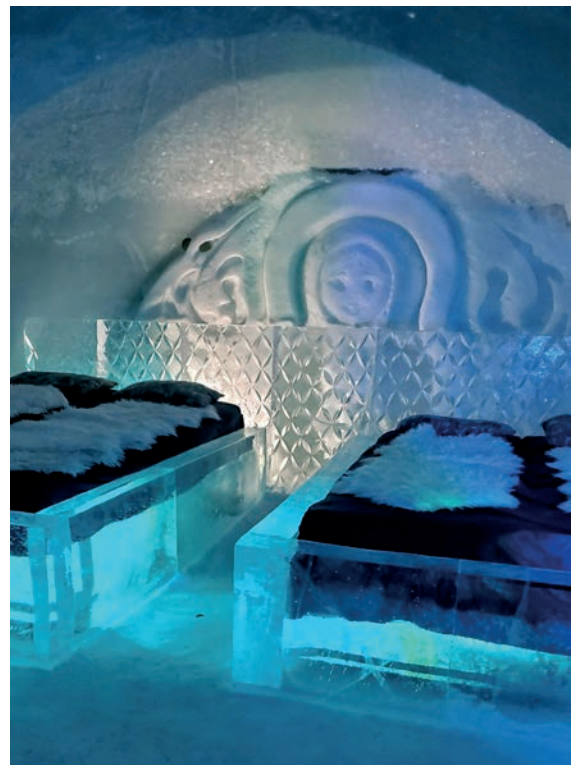
Chambre à coucher à l'Hotel de glace