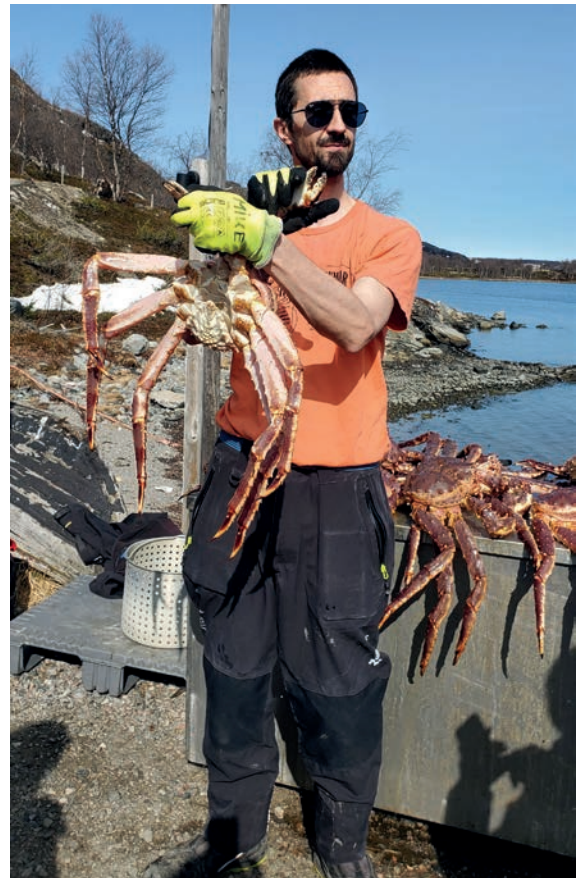
Le crabe géant norvégien

C'était l'escale nord ultime de notre croisière, lieu du demi-tour de notre navigation, avant de retrouver le sud et notre arrivée à Bergen. Nous sommes à 15 kms de la frontière russe, désormais fermée, à la suite de l'invasion de l'Ukraine. Cette escale nous a permis de découvrir le crabe royal à l'occasion d'une excursion en bateau qui nous a conduits dans un fjord sur un lieu de pêche où sont conservés ces fameux crabes. Des monstres d'une taille exceptionnelle (certains peuvent atteindre 2m d'envergure). Excursion originale et vivifiante qui s'est terminée par un festin inoubliable : la norvégienne dégustation des pinces de crabes à la saveur délicieuse. On a beaucoup apprécié la visite de l'Hôtel de Glace à proximité du restaurant avec le plus grand bar à glace de Norvège et des magnifiques suites conçues à base de neige et de glace.