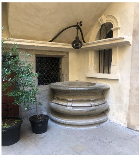
Galerie Delorme le puits