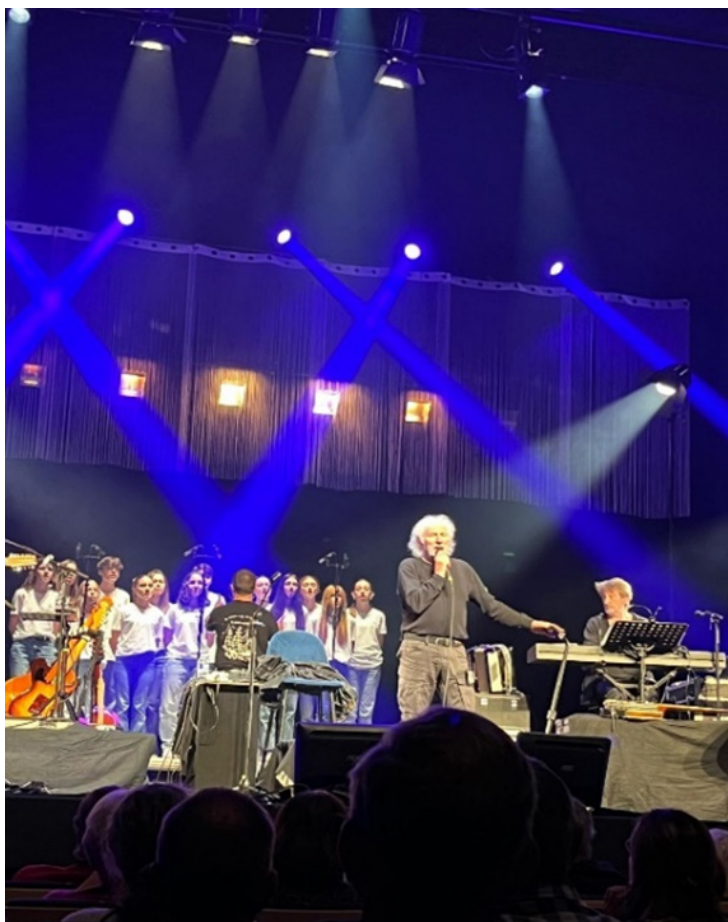
Hugues Aufray et la chorale de Saint-Chamond

La salle du Radiant Bellevue de Caluire était quasiment comble ce dimanche 6 octobre 2024 avec, certes, beaucoup de têtes blanches, mais quelle ambiance !