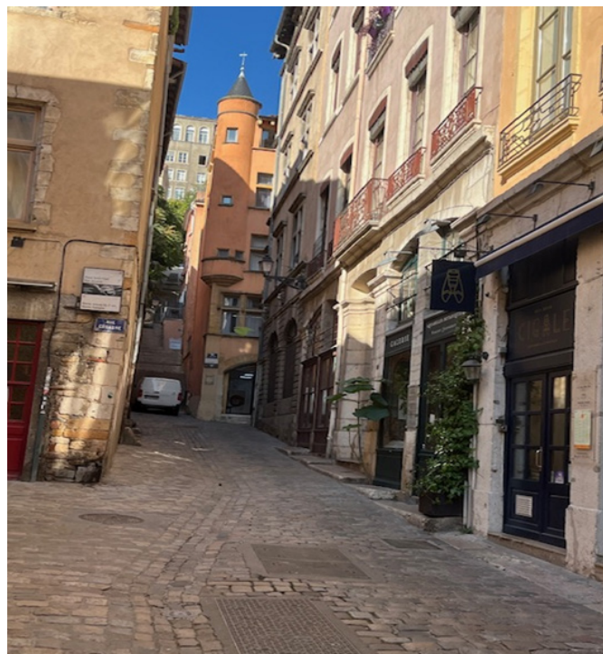
Rue Gadagne avec le musée au fond

Partie de Saint-Paul, la visite s'est poursuivie à Saint-Jean pour s'achever à Saint-Georges, incluant ainsi les trois quartiers du Vieux-Lyon. Grâce à l'érudition de notre guide, à travers la découverte passionnante de plus d'une quinzaine de sites insolites que, promeneurs non avertis,