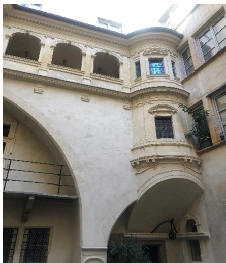
Galerie Delorme tourelle