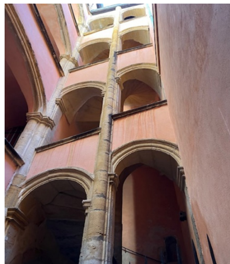
Galerie Delorme l'escalier

réputée et ses marchands faisaient partie du petit cercle des banquiers du Roi. C'est encore dans cette rue qu'a existé pendant très longtemps une horlogerie réputée, qui a inspiré le film de Bertrand Tavernier L'horloger de Saint-Paul , sorti en 1974.