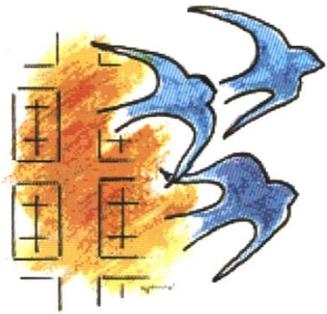
Illustration Jean Lejamtel